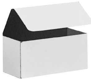
Prix par boîte