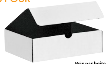
Prix par boîte