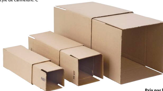
Prix par boîte