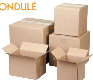
Prix par boîte