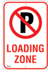
12" x 18" SGP347