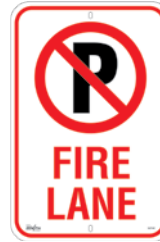
12" x 18" SGP345