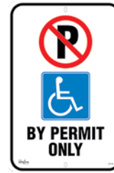
12" x 18" SGP338