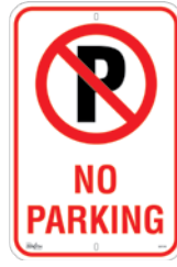
12" x 18" SGP348