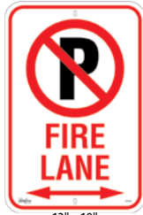
12" x 18" SGP346