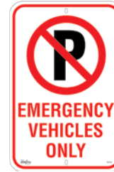
12" x 18" SGP344