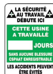
20" x 14" SEJ377 28" x 20" SEJ378 Anglais Français SEL068 SEL069