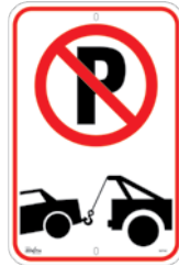
12" x 18" SGP342

Aluminium réfléchissant avec pelliculage anti-UV – Pelliculage réfléchissant de qualité technique laminé sur nos enseignes vierges en aluminium avec des trous de fixation centrés en haut et en bas.