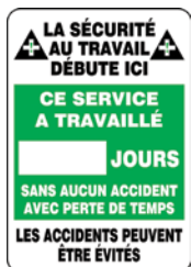
20" x 14" SAV223 28" x 20" SAV224 Anglais Français SEL064 SEL065