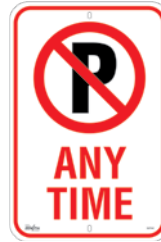
12" x 18" SGP343