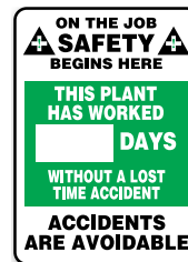
20" x 14" SAV221 28" x 20" SAV222