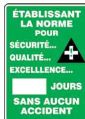
20" x 14" SAV219 28" x 20" SAV220 Anglais Français SEL066 SEL067