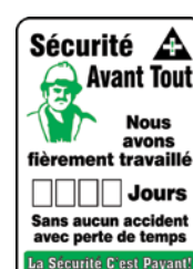
20" x 14" SEJ379 28" x 20" SEJ380 Anglais Français SEL070 SEL071