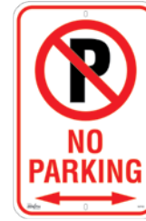
18" x 24" SAX514