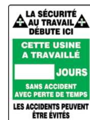
20" x 14" SEE334 28" x 20" SEE335